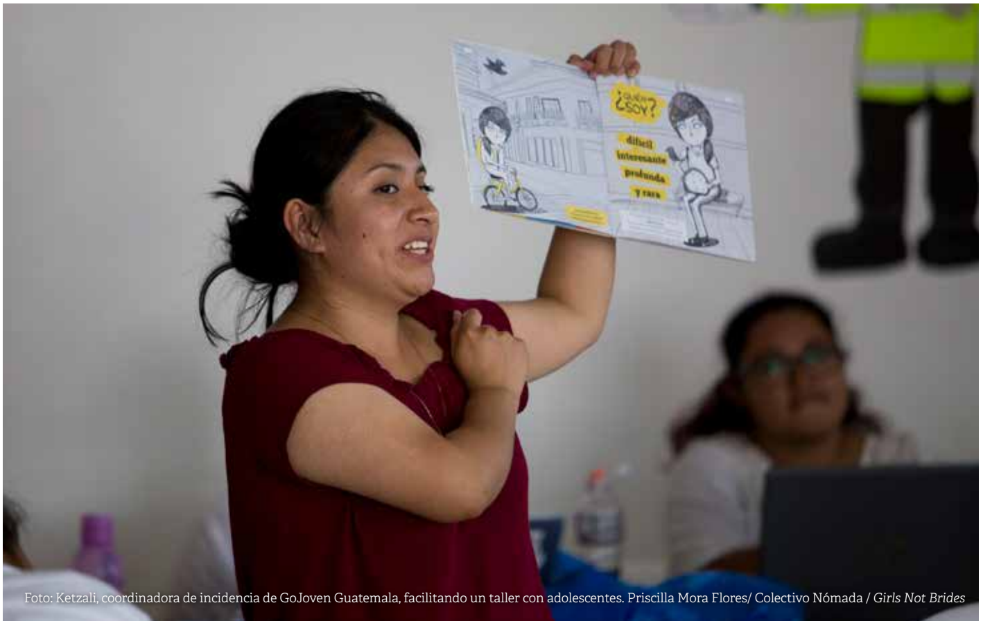
Foto: Ketzali, coordinadora de incidencia de GoJoven Guatemala, facilitando un taller con adolescentes. Priscilla Mora Flores/ Colectivo Nómada / Girls Not Brides

Durante los últimos cuatro años, seis países han cambiado sus leyes para retrasar el matrimonio: Costa Rica, Honduras, Ecuador, Panamá, México, y Guatemala. 37, 38, 39, 40 Sin embargo, un estudio reciente subraya que los cambios legislativos recientes para prohibir MUIF se conocen poco entre los actores sociales relevantes y que no se aplican de forma sistemática, al igual que otras leyes que protegen los intereses de las niñas y adolescentes que anteceden las leyes sobre MUIF (por ejemplo las leyes sobre violencia contra las mujeres). Por otro lado, el tema no ha sido integrado como un problema significativo a nivel de políticas públicas en ALC, por lo que ningún país de la región tiene un plan nacional para prevenir y responder a los MUIF, las respuestas nacionales a la violencia contra las mujeres no lo abordan y solo pocos lo mencionan como parte de sus programas nacionales para prevenir el embarazo en la adolescencia. 11