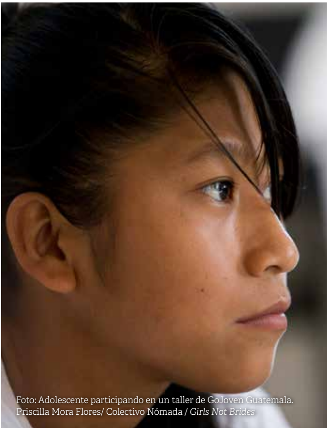
Foto: Adolescente participando en un taller de GoJoven Guatemala.