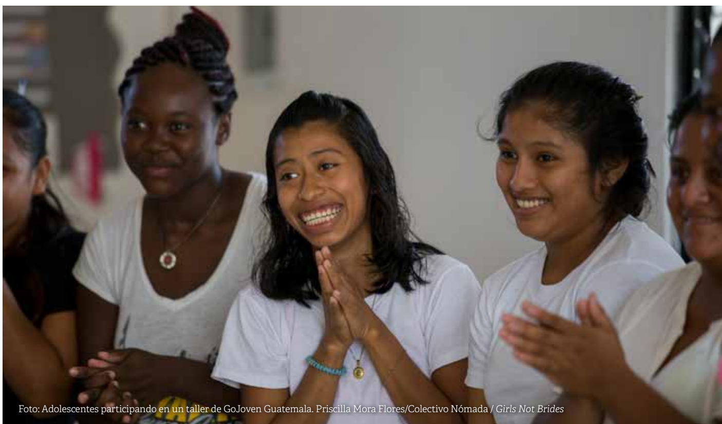
Foto: Adolescentes participando en un taller de GoJoven Guatemala.